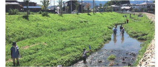
上西郷川 里川の再生 (福岡県福津市)

島谷幸宏/林博徳/来仙義久/松尾耕太郎/浅野隆史/児玉智久/大嶋正紹/九州大学大学院工学研究院 流域システム工学研究室/福津市役所建設課/福岡南小学校/株式会社富士総合技術コンサルタント宗像事務所/株式会社オオバ九州支店/上西郷川 日本一の郷川をめざす会