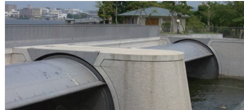
天神川水門 (島根県松江市)

重山陽一郎/山本晋一/久一博世/加賀清/西尾正博/神庭治司/国土交通省 中国地方整備局 出雲河川事務所/松江市景観審議会/松江市 歴史まちづくり部 公園緑地課/島根県 河川課/出雲土建株式会社/松江土建株式会社/株式会社IHIインフラシステム