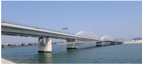
太田川大橋 (広島県広島市)

樫木洋子/渡邊康人/二井昭佳/西山健一/安仁屋宗太/岡村仁/原光夫/長谷川政裕/菅野智宏/今西修久/株式会社エイト日本技術開発/広島市道路交通局道路部街路課/広島南道路太田川放水路橋りょうデザイン提案競技選考委員会