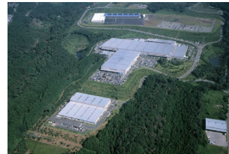
近自然コンセプトによる サンデンフォレスト・赤城事業所の 敷地造成 (群馬県前橋市)

牛久保雅美/C.W.ニコル/福留脩文/芳之内祐司/西山穂/山下英治/山路隆雄/竹内公一/サンデンホールディングス株式会社/一般財団法人 C.W.ニコル アファンの森財団/株式会社西日本科学技術研究所/鹿島建設株式会社/佐田建設株式会社