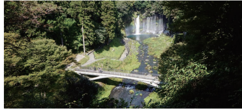
白糸ノ滝滝つぼ周辺環境整備 (静岡県富士宮市)

佐藤和幸/石川泰裕/森西洋之/天野光一/関文夫/伊東靖/石原大作/渡邊一弘/山崎路明/長谷川剛/渡井永治/白糸の滝整備計画委員会/富士宮市役所/静岡県富士土木事務所/日本大学理工学部/パシフィックコンサルタンツ株式会社/富士設計株式会社/ドービー建設工業株式会社/佐野藤建設株式会社